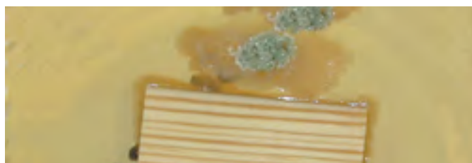
Coupe d'essai 2: Bois traité avec Induline SW-900IT (Imprégnation PREFAL)