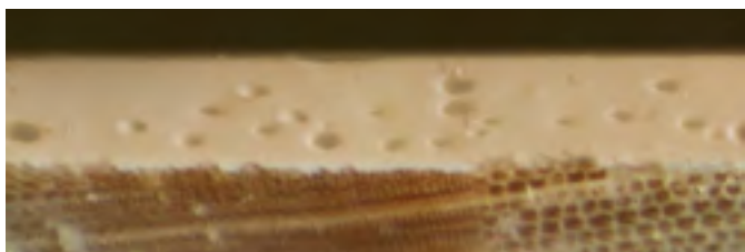
"Tapis de mousse" lors de l'utilisation de revêtements traditionnels