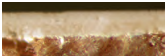
Surface revêtue avec Induline LW-700 : faible formation de mousse